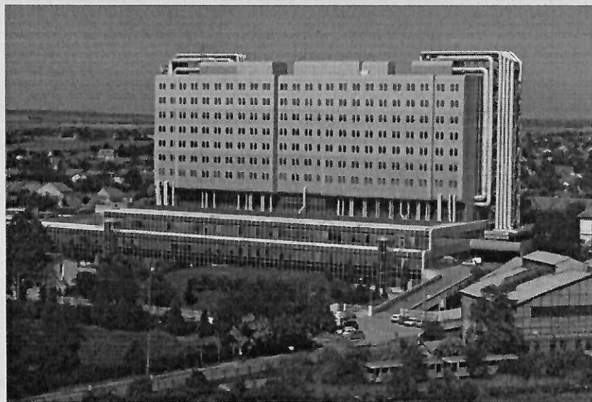
Opšta bolnica Zrenjanin

Paviljonskog je tipa i smeštena u 10 objekata ukupne površine 39.072 m 2 .